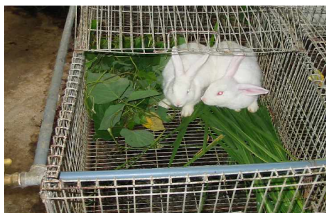
Conejo Nueva Zelanda consumiendo leguminosas y pasto saboya.