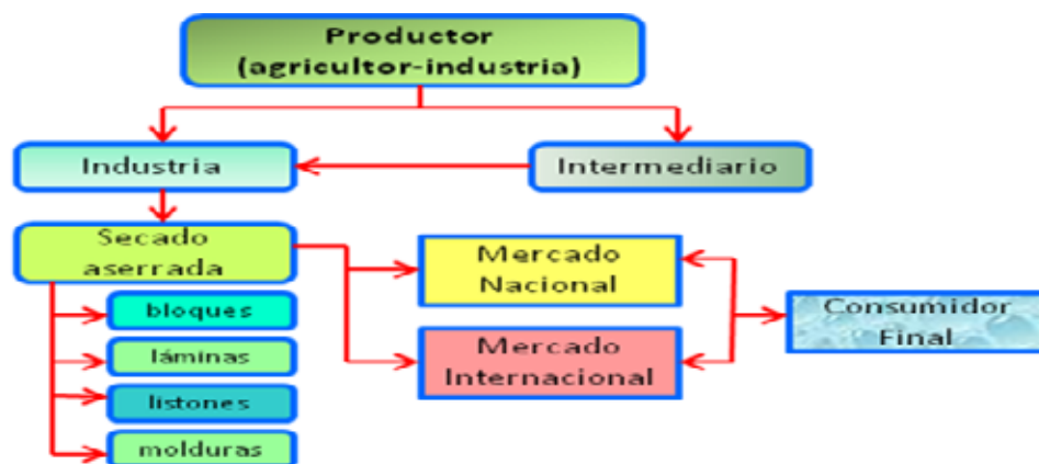
Figura 1. Cadena de comercialización de la balsa en la Provincia de los Ríos

En nuestro país existen dos grupos de productores: las industrias, que además de producir, fabrican o procesan balsa en productos terminados; y los campesinos, que la cultivan y venden en pie directamente en las fincas a los intermediarios (Figura 1). En la provincia de Los Ríos las empresas BALSAFLEX,